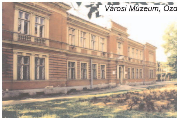
Városi Múzeum, Ózd